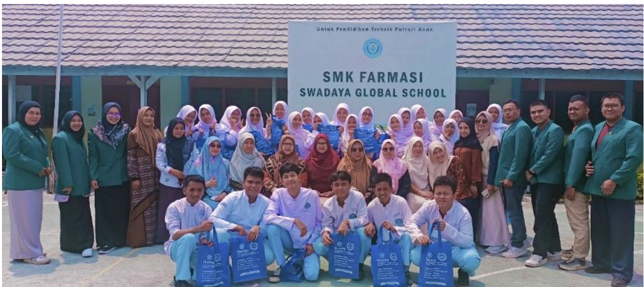
Gambar 4. Foto Bersama antara pihak tim pengabdian dan mitra pengabdian

Antusiasme peserta sangat tinggi pada pemberian materi ini. Peserta memberikan banyak respon dan pertanyaan mengenai produk kosmetika yang pernah mereka gunakan. Hal ini diharapkan dapat meningkatkan kesadaran siswa dalam pemilihan kosmetika yg aman dan halal [12–13]. Peserta juga terlihat memahami materi yang diberikan, ditandai dengan peningkatan nilai post test dibandingkan pretest. Beberapa review dari peserta yang tertulis di post test adalah “Sangat bermanfaat dan menambah ilmu pengetahuan tentang kehalalan kosmetik” dan “Seneng banget dikasih penjelasan seperti ini, kalau bisa sering mungin untuk memberikan edukasi kemasyarakatan agar masyarakat lebih pintar”