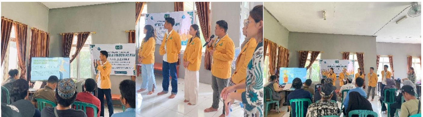
Gambar 2. Sosialisasi potensi ekonomi padi gunung di Desa Sekurau Atas

Selain itu, sosialisasi menekankan pentingnya branding, sertifikasi, dan strategi pemasaran agar produk padi gunung dari Desa Sekurau Atas dapat memiliki nilai tambah yang lebih tinggi. Diskusi interaktif dilakukan untuk menggali pengalaman, kendala, serta harapan masyarakat dalam pengembangan padi gunung, sehingga peserta tidak hanya menerima informasi tetapi juga terlibat dalam merumuskan langkah pengembangan ke depan. Melalui sosialisasi ini, masyarakat diharapkan semakin menyadari bahwa padi gunung bukan hanya sebagai komoditas pangan, tetapi juga memiliki potensi ekonomi yang dapat meningkatkan kemandirian ekonomi desa [8].