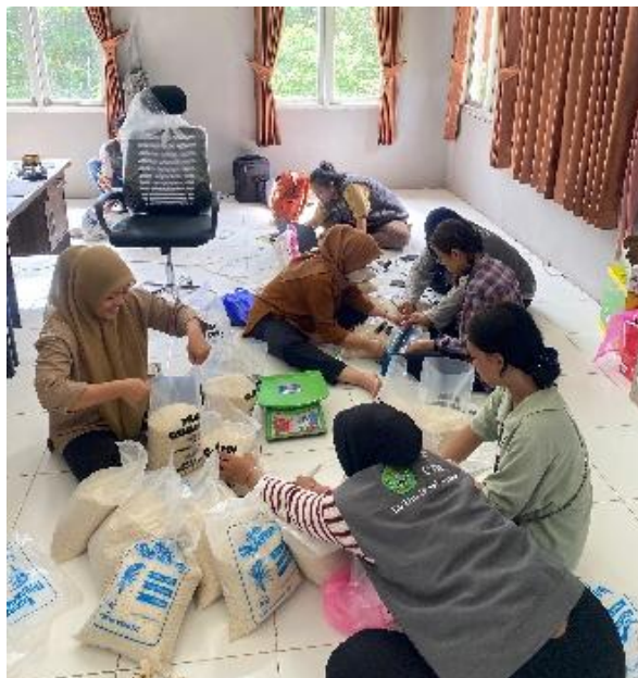
Gambar 3. Pendampingan pengemasan produk padi gunung di Desa Sekurau Atas