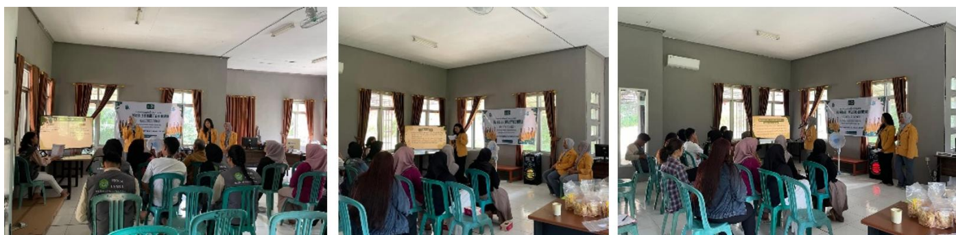
Gambar 4. Edukasi tentang NIB, PIRT dan Sertifikasi Halal di Desa Sekurau Atas

Pada sesi sosialisasi, tim menjelaskan bahwa NIB berfungsi sebagai identitas resmi pelaku usaha yang dikeluarkan melalui sistem perizinan berusaha terintegrasi secara elektronik (OSS). Dengan memiliki NIB, pelaku UMKM memperoleh kemudahan dalam mengakses fasilitas pemerintah, termasuk permodalan dan program pemberdayaan usaha. Selanjutnya, peserta diberikan pemahaman tentang pentingnya izin PIRT bagi produk pangan olahan rumah tangga. PIRT menjamin bahwa produk yang dihasilkan aman dikonsumsi dan telah memenuhi standar kesehatan yang berlaku. Hal ini menjadi penting mengingat sebagian besar produk padi gunung yang dipasarkan berupa beras kemasan untuk konsumsi langsung. Selain itu, sosialisasi juga menekankan peran sertifikasi halal sebagai salah satu strategi meningkatkan kepercayaan konsumen, terutama di Indonesia yang mayoritas penduduknya beragama Islam. Dengan adanya sertifikasi halal, produk padi gunung tidak hanya memiliki nilai tambah, tetapi juga berpeluang lebih besar untuk menembus pasar regional dan nasional [12].